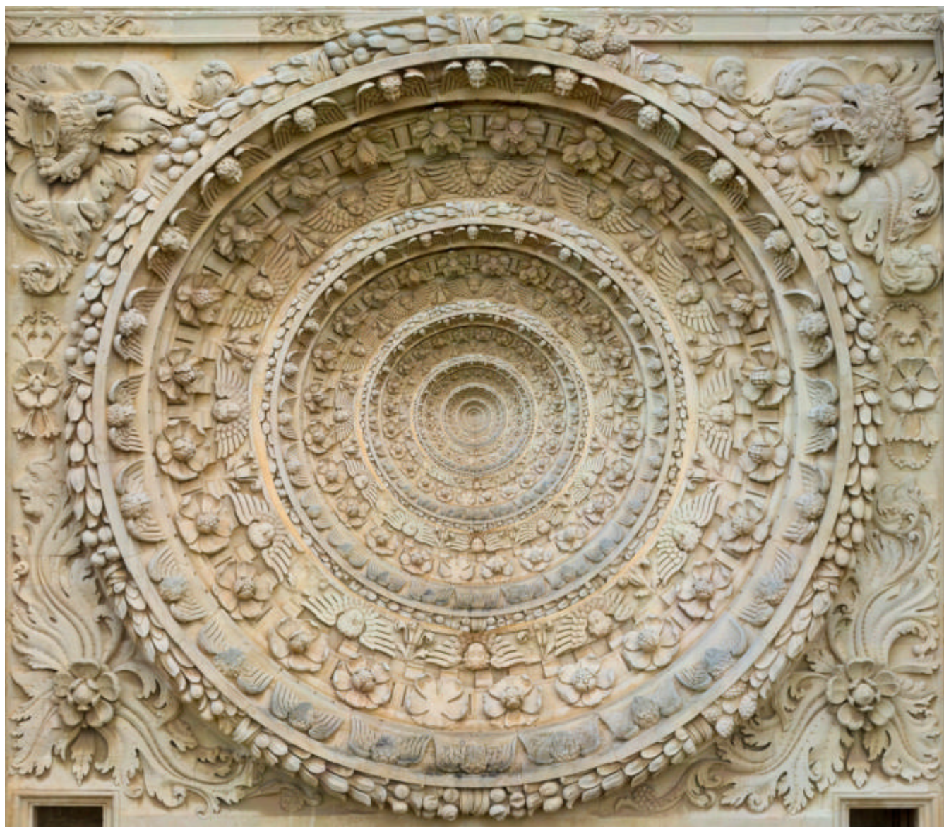
Elaborazione Matematica del Rosone della Basilica di Santa Croce in Lecce cui è stato applicato un processo iterativo autosimilare

Lecce360 è un progetto di studio e ricerca nato dalla sinergia tra alcuni brillanti fotografi leccesi e uno studioso dei modelli matematici della percezione visiva. I risultati delle attività sono molteplici ed hanno come denominatore comune la capacità di estendere il dominio della comunicazione visiva oltre i limiti della stampa, simulare il mondo reale tridimensionale e permetterne la fruizione a distanza attraverso un normale collegamento ad Internet.