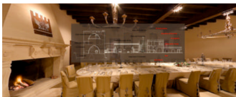
Torre del Parco - Lecce

Un Virtual Tour è un prodotto multimediale in cui più Fotografie Immersive vengono collegate e rese navigabili attraverso un meccanismo di pulsanti e indicatori di direzione liberamente costruibile. Il vantaggio rispetto alle singole Fotografie Immersive deriva dalla possibilità per il fruitore del prodotto di costruire il proprio viaggio virtuale nel bene architettonico visitato, mentre per l'autore diventa possibile aggiungere ulteriori componenti multimediali, come schede descrittive, suoni direzionali o inserti video che si attivano in contesti adatti.