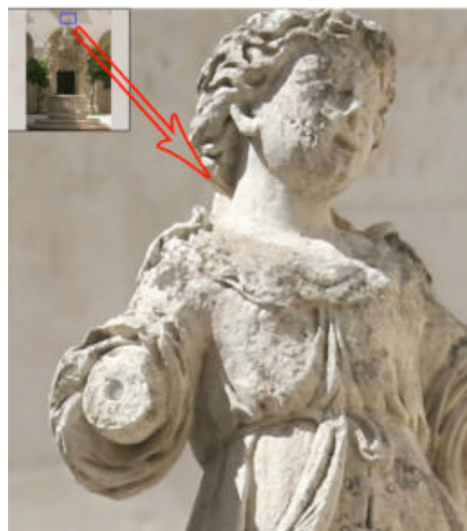
Particolare del Pozzetto dell'Antico Seminario