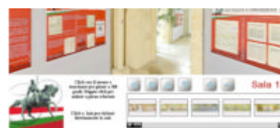
Mostra Documentaria su Garibaldi