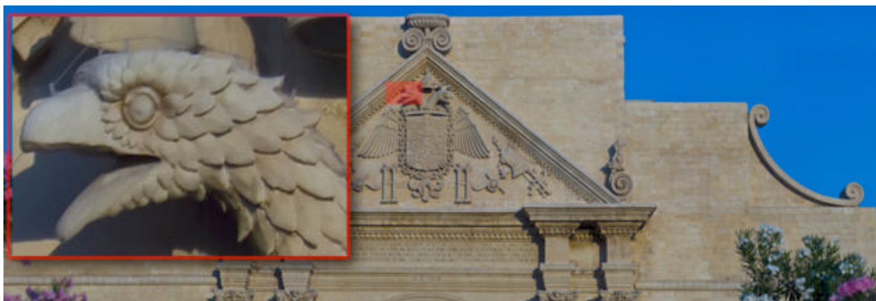
Particolare del Timpano dell'Arco di Porta Napoli recentemente restaurato