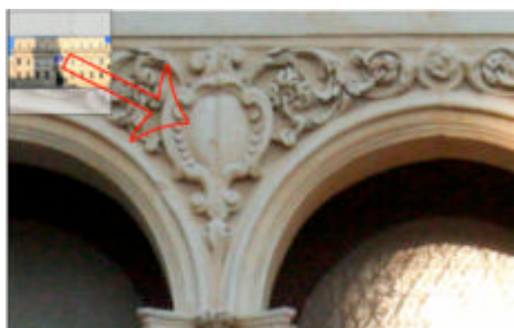
Particolare del Palazzo dell'Antico Seminario